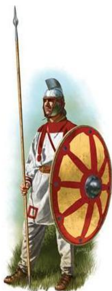
Ρωμαίος στρατιώτης του 5ου αι. μ.Χ